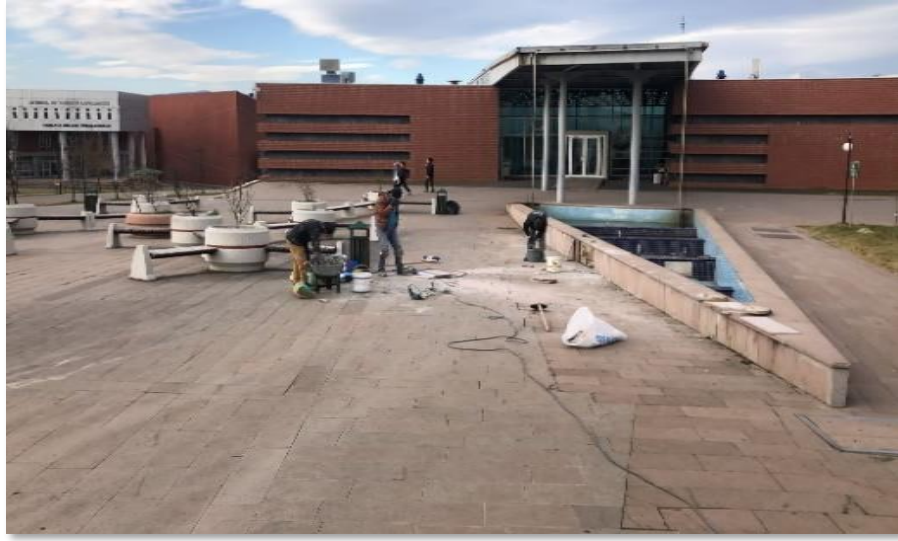
Büyük Onarım 2021 ihalesi kapsamında yapılan işlere ait görseller