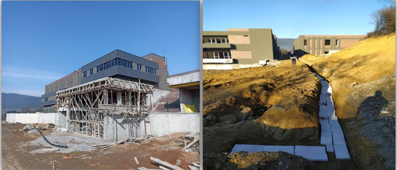
Kampüs Altyapısı 2021 ihalesi kapsamında yapılan işlere ait görsellerden

Üniversitemiz su ihtiyacını karşılayan su kuyularında bulunan pompaların yenilenmesi, Yeniçağa Yaşar Çelik MYO doğalgaz tesisatlarının yapılması ile sistemin verimliliği ve ömrünü uzatmak için eşanjör kurulumunun yapılması işleri gerçekleştirilmiştir.