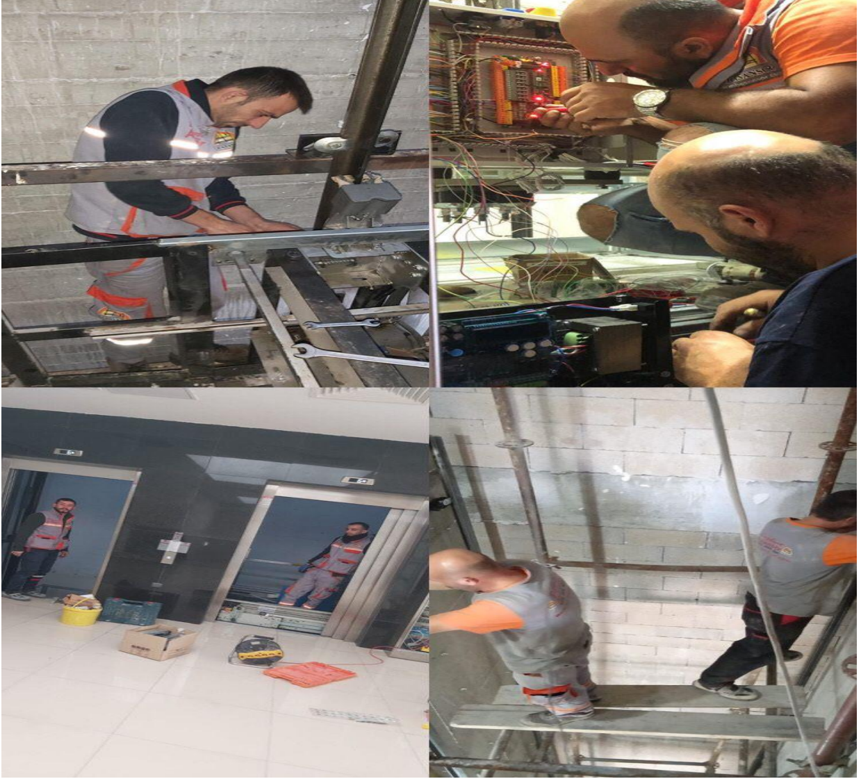
Asansör onarımlarına ait görseller